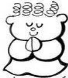
Los de espíritu de pobre