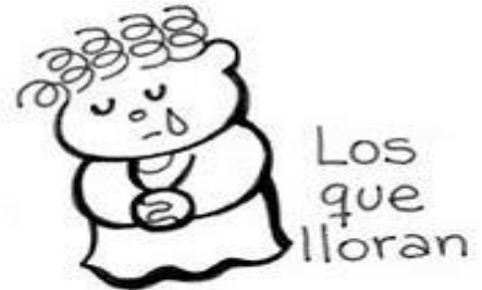
Los que lloran