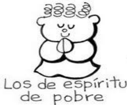
Los de espíritu de pobre