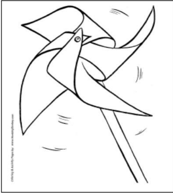
VIENTO-impulsa a la acción