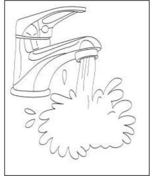
AGUA- limpia y da vida