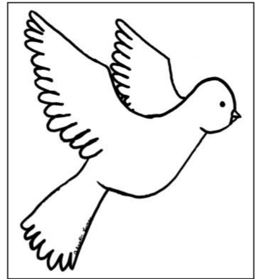
PALOMA-refleja paz y pureza