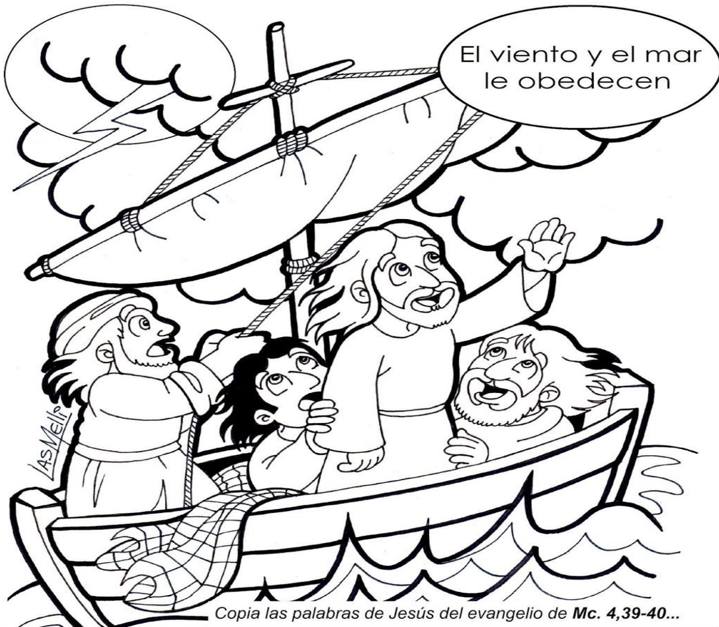
Copia las palabras de Jesús del evangelio de Mc. 4,39-40...

Jesús se despertó (en medio de la tormenta), se encaró con el viento y dijo al mar: