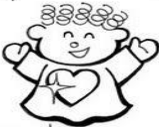
Los de Corazón Limpio