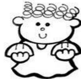
Los que aman la Justicia