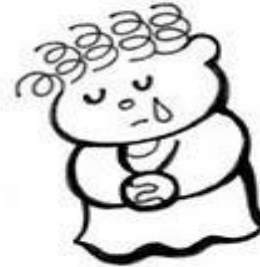
Los que lloran