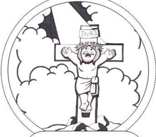
Undécima Estación: Jesús es clavado en la cruz.