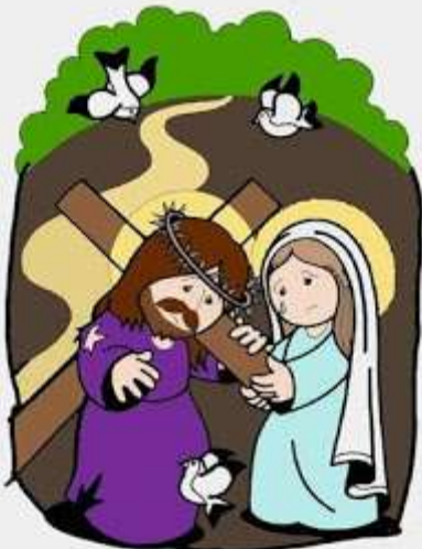
4º Estación: Jesús encuentra a su madre

Simeón dijo a María, su madre: "A ti, una espada te atravesará el alma". (Lucas 2, 35)