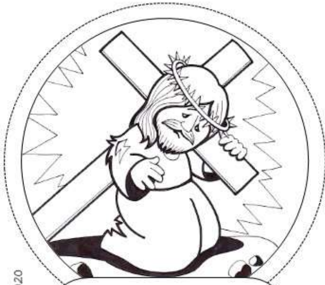
Séptima Estación: Jesús cae por segunda vez.