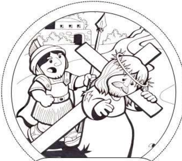
Segunda Estación: Jesús carga con la cruz