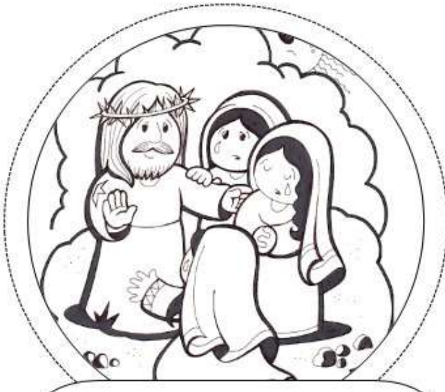
Octava Estación: Jesús encuentra a las mujeres de Jerusalén.