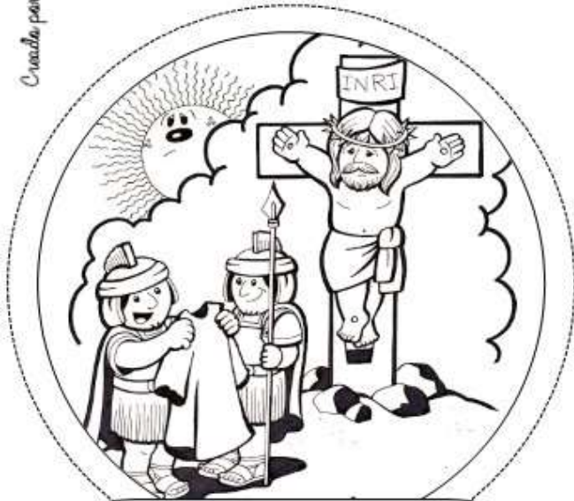
Décima Estación: Jesús es despojado de sus vestiduras.