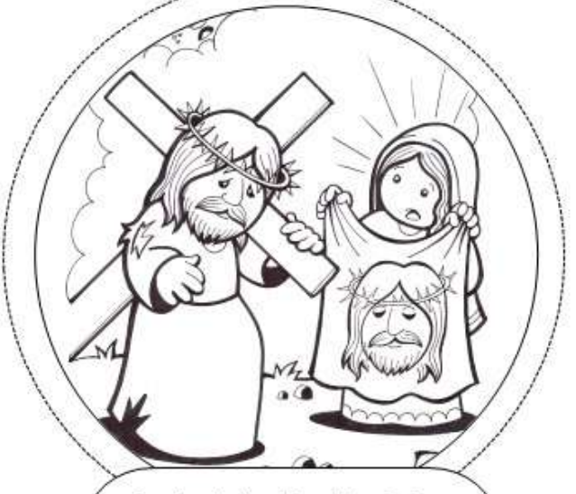
Sexta Estación: Verónica limpia el rostro de Jesús.