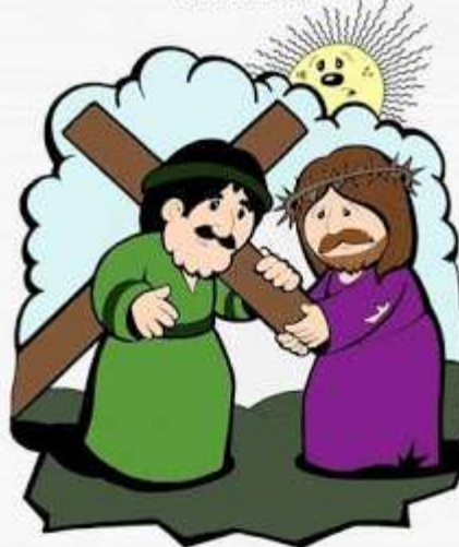
5º Estación: El Cireneo ayuda a Jesús a llevar la cruz

"Al salir se encontraron con Simón de Cirene, que volvía del campo, y lo obligaron a llevar la cruz de Jesús". (Marcos 15, 21)