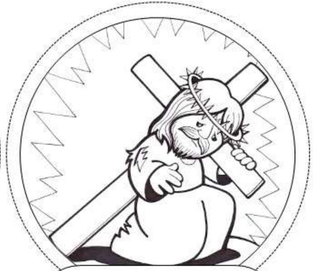
Tercera Estación: Jesús cae por primera vez.