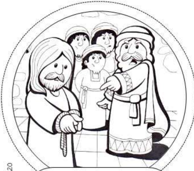
Primera Estación: Jesús es condenado a muerte