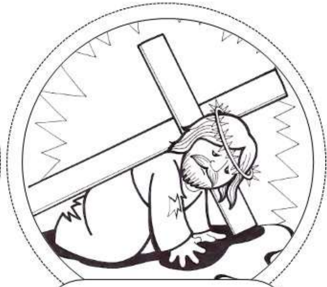
Novena Estación: Jesús cae por tercera vez.