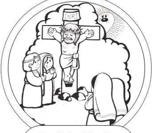
Duodécima Estación: Jesús muere en la cruz.