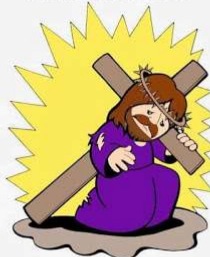
3º Estación: Jesús cae por primera vez

"Eran nuestras dolencias las que llevaba, eran nuestros dolores los que le pesaban". (Isaías 53, 4)