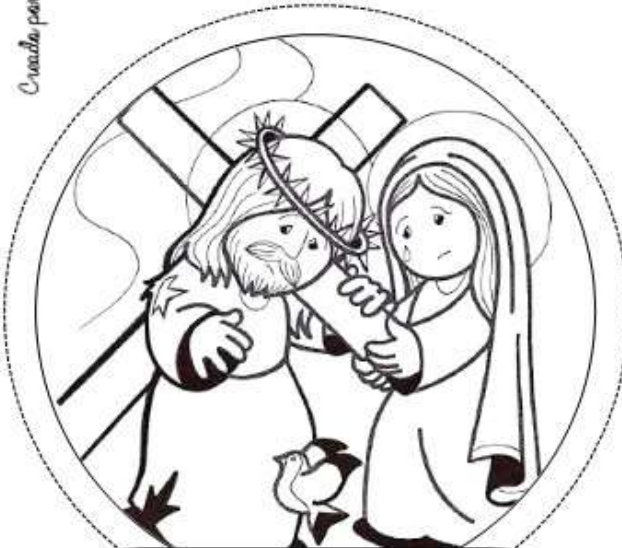
Cuarta Estación: Jesús encuentra a su madre María