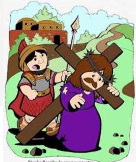
2º Estación: Jesús carga con la cruz

"Jesús llevaba la cruz a cuestas y salió a un lugar llamado Gólgota". (Juan 19, 17)