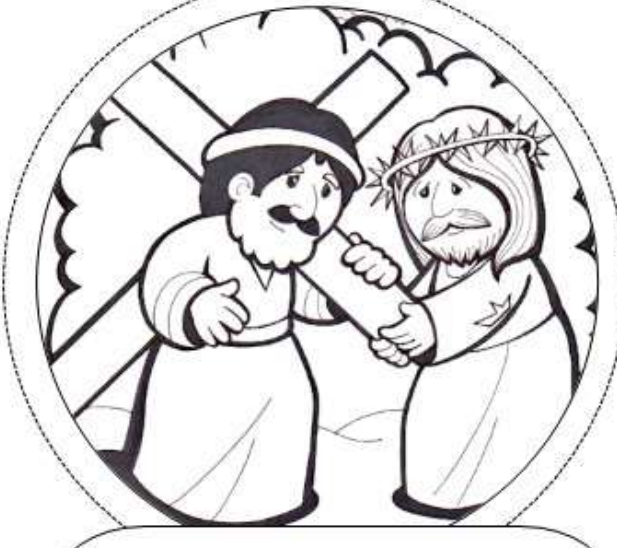
Quinta Estación: Simón el Cirineo ayuda a Jesús a llevar la cruz