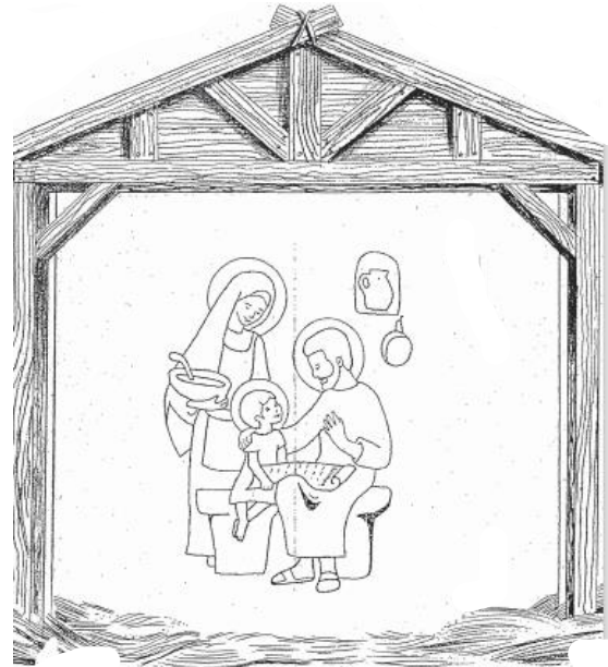
LA CASITA DE NAZARETH

El Espíritu Santo concibió a Jesús en el vientre de María. Ella lo cuidó con mucho amor.