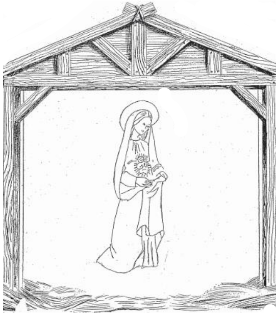
LA VIRGEN MARIA

El Espíritu Santo concibió a Jesús en el vientre de María. Ella lo cuidó con mucho amor.