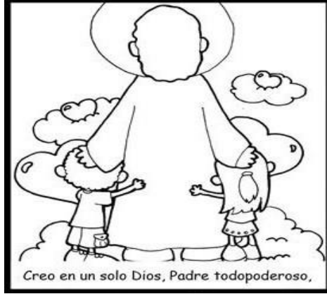
Creo en un solo Dios, Padre todopoderoso,

Creo en Dios Padre Todopoderoso, Creador del cielo y de la tierra: