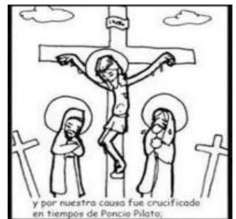
y por nuestra causa fue crucificado en tiempos de Poncio Pilato;

Creo en Jesucristo su único hijo, que se hizo hombre y murió por salvarnos.