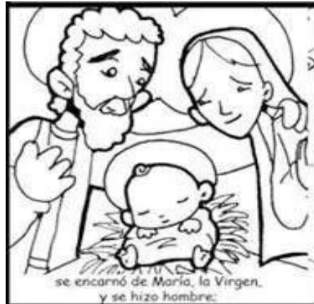
se encarnó de María, la Virgen, y se hizo hombre;