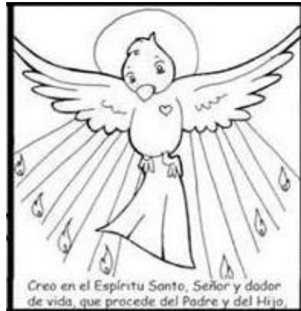
Creo en el Espíritu Santo, Señor y dador de vida, que procede del Padre y del Hijo,