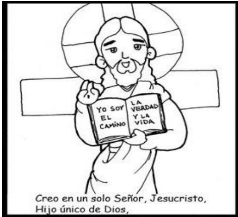
Creo en un solo Señor, Jesucristo, Hijo único de Dios,