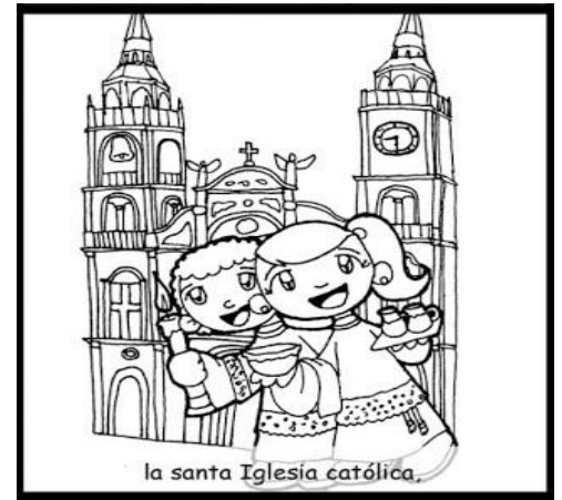
la santa Iglesia católica,