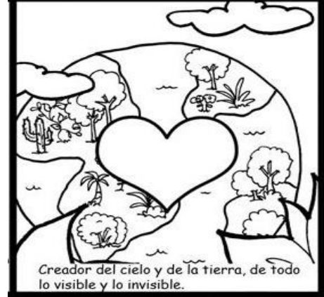
Creador del cielo y de la tierra, de todo lo visible y lo invisible.