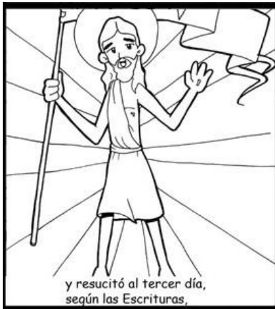
y resucitó al tercer día, según las Escrituras,

Creo en Jesucristo su único hijo, que se hizo hombre y murió por salvarnos.