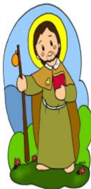
Santiago el Mayor