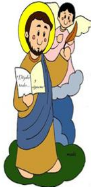
San Mateo Evangelista

Al encontrarse con Jesús, este le reveló que lo había visto orando "debajo de la higuera" antes de que Felipe lo llamara. Por esto, el reconoce que Jesús es el Hijo de Dios. Jesús le dijo que era un "israelita en el cual no hay engaño".