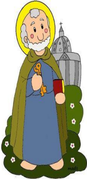
San Pedro Apóstol

Instrucciones: Cortar un papel de construcción en 3 partes. Cortar cuadrado con 4 evangelistas y sus descripciones. Doblar en la mitad, dibujos de un lado y explicaciones del otro. Pegar pedazo de construcción entre los dos dejando 1/8" arriba. Doblar como acordeón y pegarlos con tape para hacer un libro de acordeón. Canción: https://youtu.be/wModj84r0c0