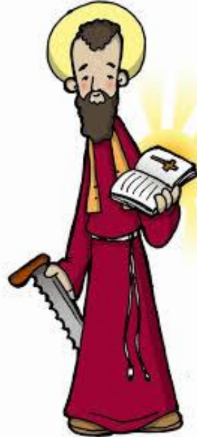
Simón el Zelote