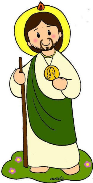
San Judas Tadeo