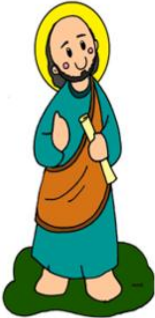
San Felipe Apóstol