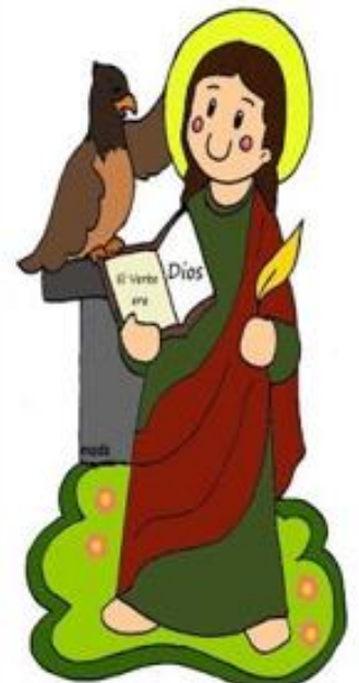
San Juan Evangelista