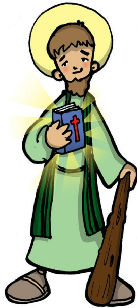
Sto. Santiago el Menor