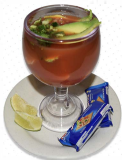
Coctel de Camaron

Shrimp a la diablo/Camarones a la diablo 17.00