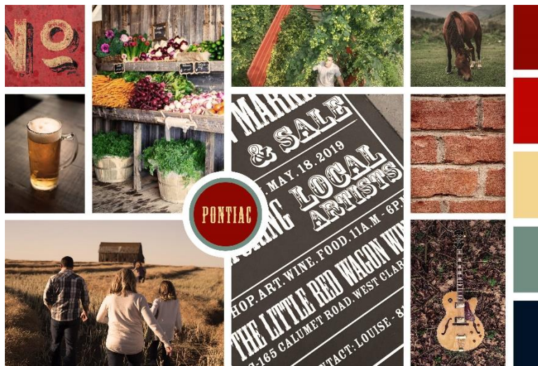
Planche #1 | Dans ce que vous voyez, qu'est-ce qui représente le plus la vie dans la région ? Commentez les couleurs, les photos, les icônes, le style d'écriture, la forme des lettres, etc.

Indiquez ce qui représente le plus la vie dans la région dans les trois (3) propositions suivantes.