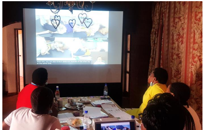
1. 11월 2기 집중치료팀 보호자워크숍 단체사진 2-4. 현지 재활치료사 교육 프로그램: 통합 워크숍