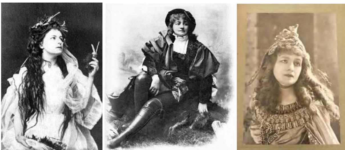
Modrzejewska jako Ofelia z Hamleta , Rosalinda, oraz Kleopatra ze sztuk Szekspira.