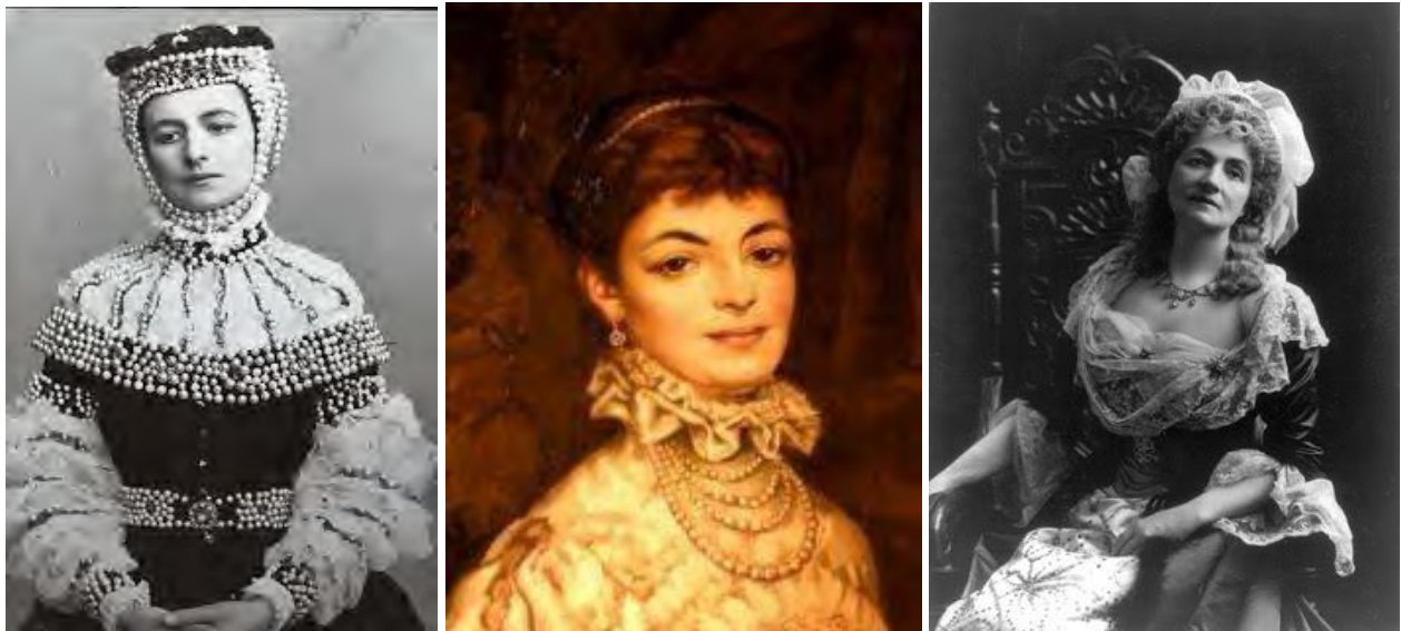
Modrzejewska w roli Barbary Radziwiłłówny (1867). Portret Modrzejewskiej, Tadeusz Ajdukiewicz, 1880 (fragment). Modrzejewska w roli Marii Antoniny.