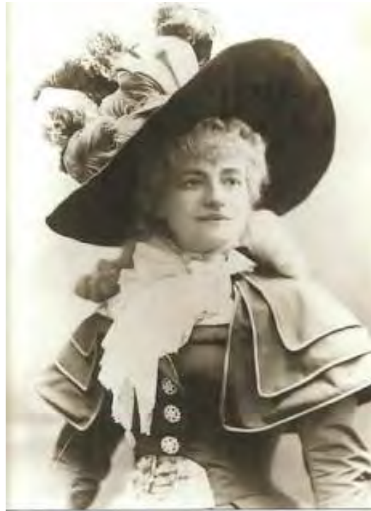
Plakat z rolami Modrzejewskiej Regulskiego, lata 1860-te. Aktorka w kostiumie Adrianny Lecouvreur.