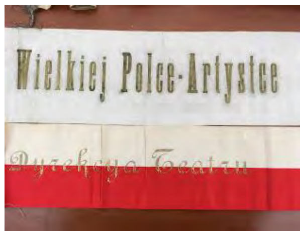
Wst żki z wieńc w z tourn e po Polsce. Opid-Modjeska Family Papers, Huntington Library, San Marino, Kalifornia.