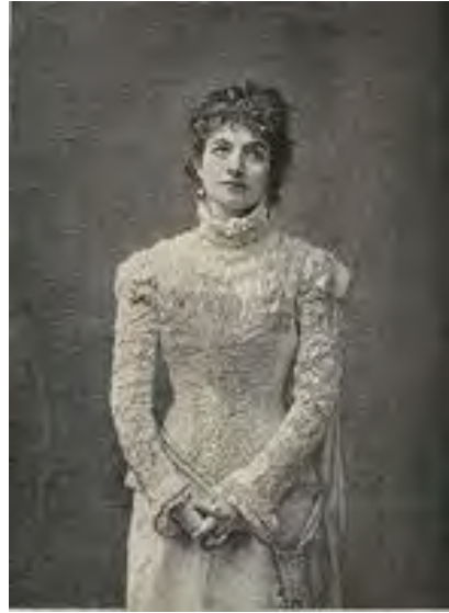
Modrzejewska jako Julia. Nowoczesna reprodukcja jej kostiumu na wystawie w Wilanowie, 2013.