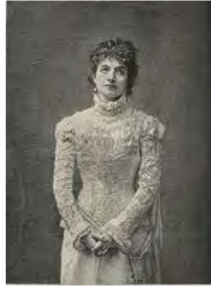
Modrzejewska jako Julia. Nowoczesna reprodukcja jej kostiumu na wystawie w Wilanowie, 2013.