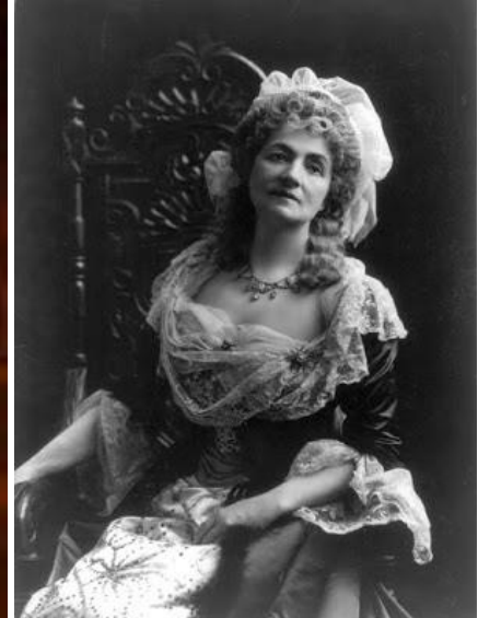
Modrzejewska w roli Barbary Radziwiłłówny (1867). Portret Modrzejewskiej, Tadeusz Ajdukiewicz, 1880 (fragment). Modrzejewska w roli Marii Antoniny.

Helena Modjeska czyli Modrzejewska była nie tylko aktorką, pisarką, czy ilustratorką, ale także reżyserem teatralnym, producentem, projektantką kostiumów, promotorem gwiazd (Ignacy Jan Paderewski, Władysław Benda), muzą artystów (pisarz Henryk Sienkiewicz; malarze; poeci Richard Watson Gilder i John Steven McGroarty), projektantem wnętrz, ikoną stylu, bizneswoman oraz marketer. Później była także właścicielką dworku, ogrodniczką i szefem jednego z najsłynniejszych ogrodników XX wieku, Theodore Payne, specjalisty od dzikich roślin Kalifornii, założyciela Theodore Payne Foundation for Wild Flowers and Native Plants.