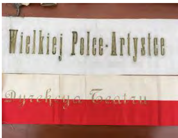
Wst żki z wieńc w z tourn e po Polsce.