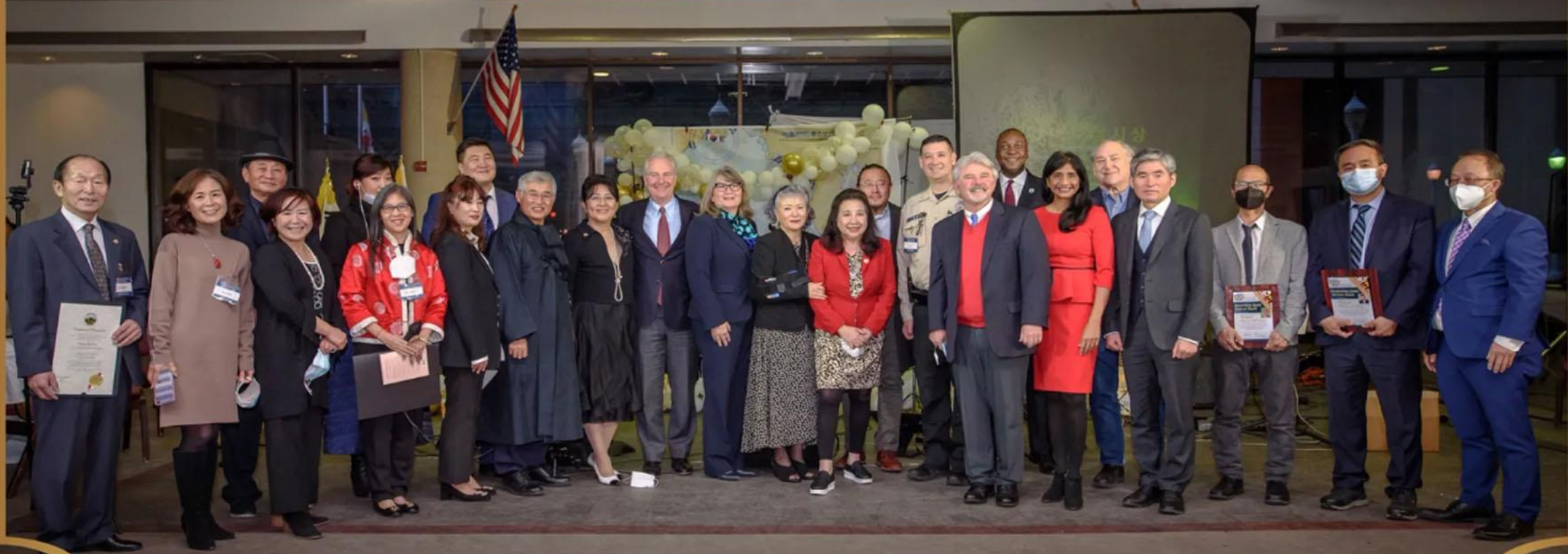
Invited Government Officials (with U.S. Senator Chris Van Hollen) and the Korean American Association of the State of MD's executives Montgomery Executive Building, Jan 30, 2022