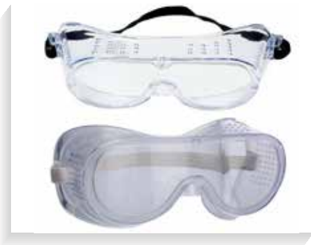
Monogafas de protección

Las monogafas de protección ofrecen seguridad adecuada para los diferentes riesgos presentes en las áreas de trabajo en especial proyección de partículas líquidas y sólidas en gran cantidad, protegen los ojos de salpicaduras y contra el impacto de cierto material particulado que vuela por el aire.