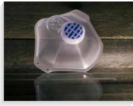
Tapabocas tipo pet

Gafas de seguridad steelpro safety, de seguridad con diseño ultraliviano de amplia visión, con protectores laterales, visor de Policarbonato oftálmico de alta transparencia, ultraliviano, filtro UV, Resistente a impactos, abrasión y salpicadura de líquidos irritantes, ópticamente aclarados y modificados para visión neutra, ultraliviano, anti-Empañante, anti-Impacto, filtro UV 99,9%.