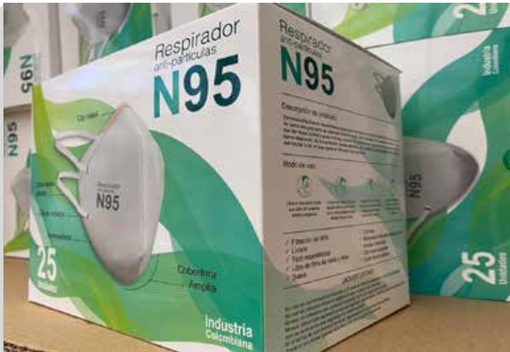
Respirador anti partículas N95

Fabricado con tela no tejida con gramaje mínimo de 18 g/m 2 , con filtro de tela no tejida con gramaje mínimo de 18 g/m 2 , con filtro de 25 g/m 2 (eficiencia de filtración de bacterias, 98%).