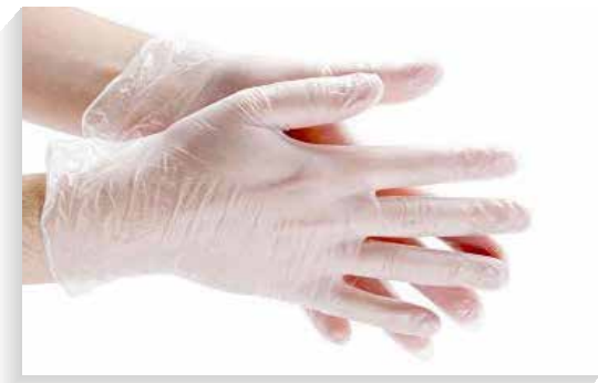
Guante de vinilo

Respirador contra partículas n95, resistente a los fluidos, cómodo con correas elásticas, empaçado individualmente, termosellado con 3 capas para mejor protección respiratoria, contra la gran mayoría de las partículas sin presencia de aceite, con materiales livianos que facilitan el uso y con mayor durabilidad de uso con hasta un 95% de eficiencia.