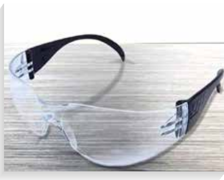
Gafas de protección

Las monogafas de protección ofrecen seguridad adecuada para los diferentes riesgos presentes en las áreas de trabajo en especial proyección de partículas líquidas y sólidas en gran cantidad, protegen los ojos de salpicaduras y contra el impacto de cierto material particulado que vuela por el aire.