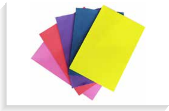
Lámina de cartón paja en 1/8 color crema. Tamaño 25 x 35 cm. Paquete x 10 unidades, así mismo en otras presentaciones.