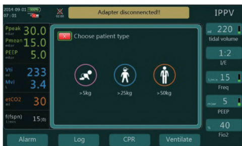
Configuración inteligente por un sólo pulsado