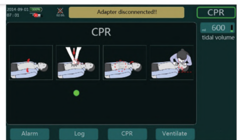
Modo rescate CPR patentado