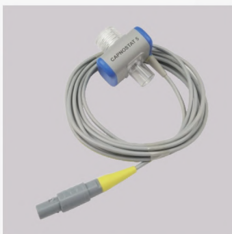
Módulo EtCO2 (opcional)