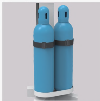
2 cilindros de oxígeno soportados (opcional)

@2020 Andes Med Todos los derechos reservados. El fabricante se reserva el derecho de modificar el diseño, empaque, especificaciones, y características. Mostrado aquí, sin previo aviso u obligación