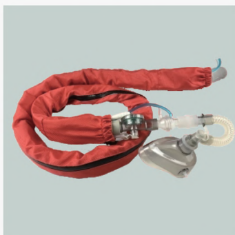
Circuito respiratorio y sensor de flujo de paciente.