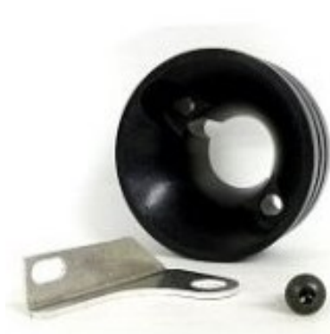
Adaptador para filtro de aire

20.2. Adaptador Filtro de Aire: Hay dos tipos de adaptores para el filtro. Uno de anodizado brillante con dos randuras en el area exterior y y el otro anodizado mate con cuatro randuras en el exterior.