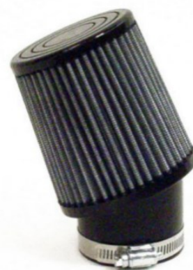
Filtro de aire

20.3 CONECTOR DE BUJIA: Unicamente se permite utilizar la el conector de bujia que suple Cronos . (Ver foto 4)