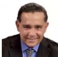
Escrito por Raymond Orta Martinez Abogado (VEN)

La firma electrónica se utiliza para autenticar y garantizar la integridad de un documento electrónico, mientras que el código QR se utiliza para identificar y recuperar documentos electrónicos en formato impreso, siempre y cuando cumpla con los requisitos establecidos por la normativa aplicable. Ambos tienen importancia en el contexto de la validez y la eficacia probatoria de los documentos electrónicos en Venezuela pero los órganos públicos deben avanzar en la implementación de firma electrónica de los documentos que se encuentren en los repositorios oficiales. Celebramos el uso del código QR por los órganos oficiales en Venezuela pero que no se le confunda con la firma electrónica de la Ley de Mensajes de Datos y Firmas Electrónicas (LMFTE) cuyo uso es obligatorio por la Ley de Infogobierno.