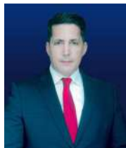
Escrito por. Richard Ramos Benavides Abogado (VEN)

En resumen, la evolución de los delitos informáticos en las últimas dos décadas refleja un cambio constante y acelerado en las tácticas de los ciberdelincuentes, destacando la necesidad continua de adaptación y fortificación de las defensas cibernéticas.