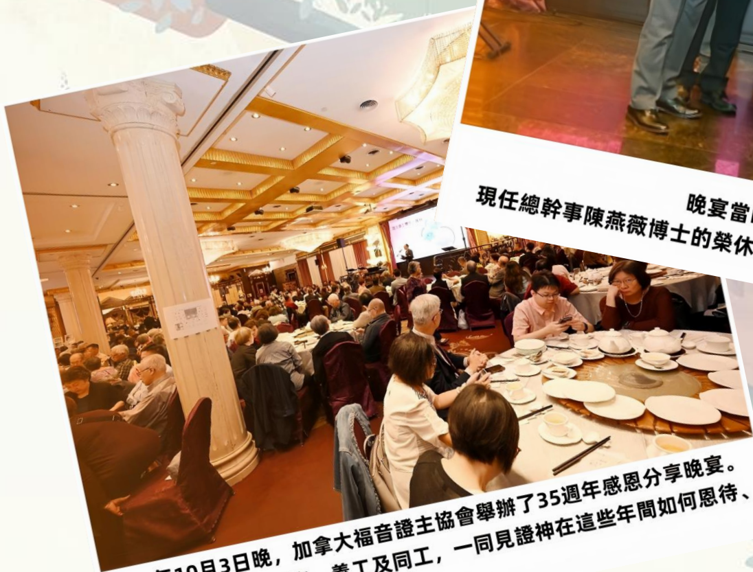
2025年10月3日晚，加拿大福音證主協會舉辦了35週年感恩分享晚宴。 當晚共有近350位嘉賓、義工及同工，一同見證神在這些年間如何恩待、 使用「證主」服侍眾教會。