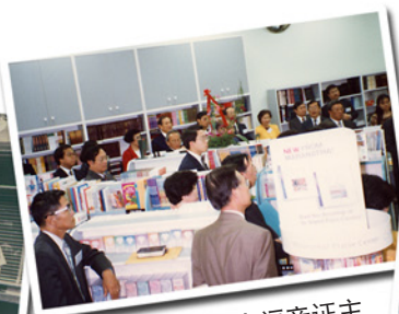
1989年，加拿大福音证主协会成立