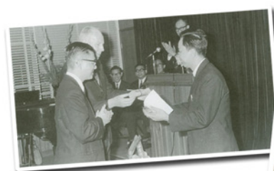
1971年4月1日，“证道出版社”及“中国主日学协会”香港区会合并礼

这一年，是福音证主协会成立第五十个年头。五十年前，神带领中国内地会属下的“证”道出版社及中国“主”日学协会两个机构结合力量，成为福音证主协会。半个世纪之后的今天，掌管历史的神仍然是我们的元首，帅领我们面对主再来之前的各种挑战。感谢神，因为有祂，我们凡事都能。请大家继续为我们祷告。