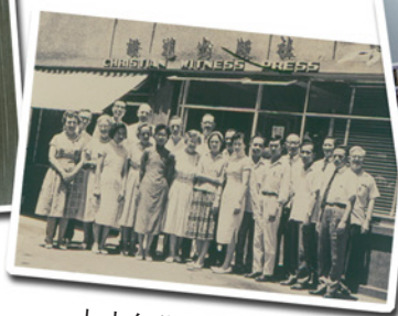
七十年代的“证道出版社”及同工