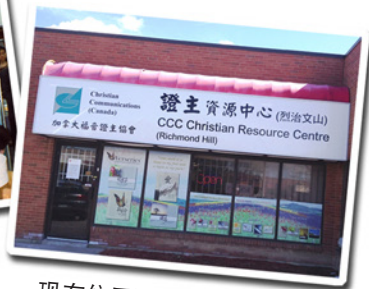
现在位于烈治文山的办公室