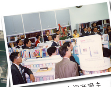
1989年，加拿大福音證主協會成立