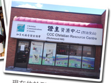
現在位於烈治文山的辦公室