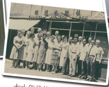
七十年代的「證道出版社」及同工