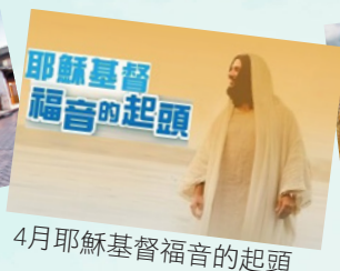
4月耶穌基督福音的起頭