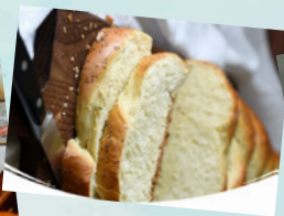
7月聖經真好吃(8) — 哈拉麵包