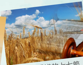
5月微不足道的七七節