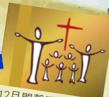
12月悶聲發大財 — 塑造靈命的崇拜禮儀程序