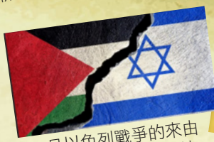
11月以色列戰爭的來由 — 認識以色列的土地