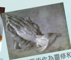
9月以藝術作為靈修和禱告的媒介