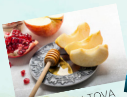
9月SHANNAH TOVA 新年好