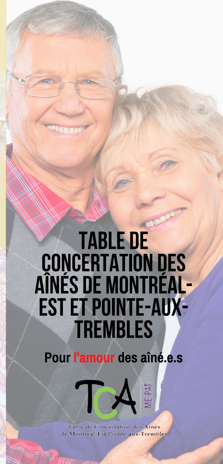
TABLE DE CONCERTATION DES AÎNÉS DE MONTRÉAL- EST ET POINTE-AUX- TREMBLES