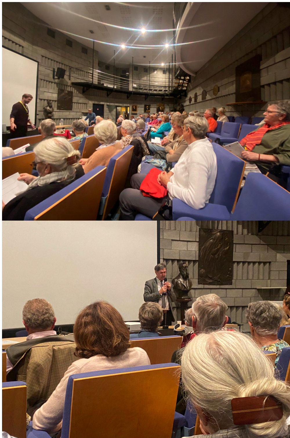
Infolettres de la Table de Concertation des Aînés de Montréal-Est et de Pointe-aux-Trembles et de l'Association Bénévole de Pointe-aux-Trembles et de Montréal-Est – Novembre 2022.