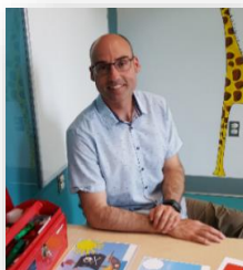
Notre fil conducteur

«Le plaisir ouvre la porte à l'apprentissage»