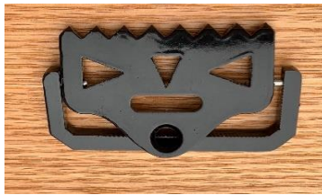
CHA205 Weight Buckle