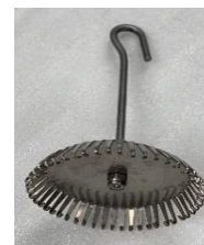
CHA223 Set-Up Basket