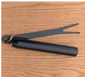
CHA201- Heel Fork Need 3

***Please note that in order to knit heels and toes you will need 3 Heel Forks & Weights CHA201