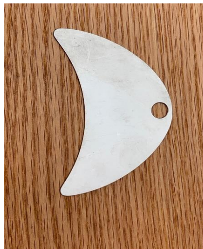
CHA209 - Crescent Tool Stainless Steel

CHA220 Pick To CHA040 Short Stitch Transfer Tool - Aluminum CHA211 Latch T Also available in brass - see prices above