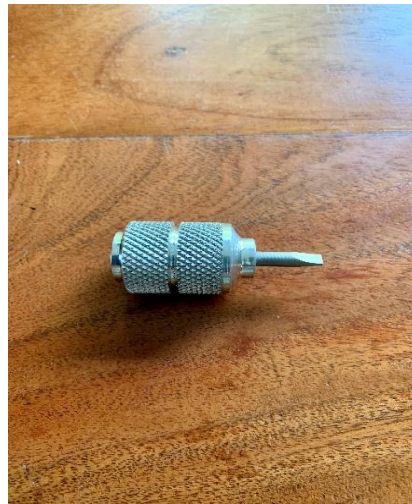
CHA062 - STUBBY Screwdriver

*** Contact us for more infos and photos - Veuillez nous contacter pour plus de photos