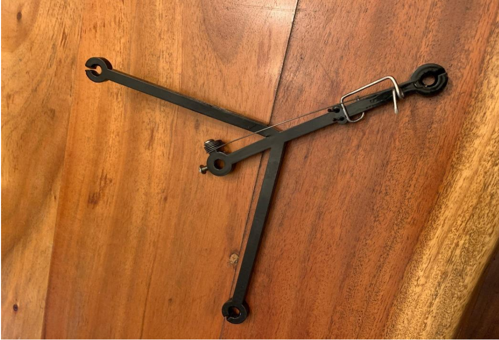
CHA228A - Slotted Yarn Mast Topper - fits several brands - specify