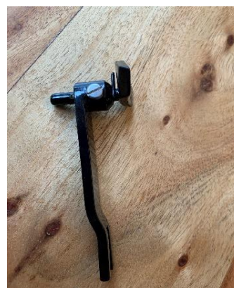
CHA222 - Slotted and Adjustable Yarn Carrier - specify brand