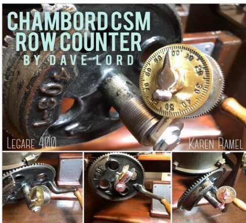
CHA203 Brass D Rotary Brass Counter

CHA220 Pick To CHA040 Short Stitch Transfer Tool - Aluminum CHA211 Latch T Also available in brass - see prices above