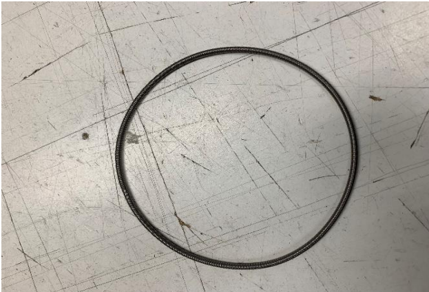
CHA006 - Cylinder Spring