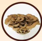
舞茸靈芝 Maitake Mushroom