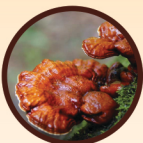
赤靈芝提取物 Reishi Mushroom