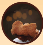
桑黃靈芝 Mesima Mushroom