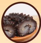
南美洲頂級海參 Sea Cucumber