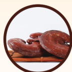
全破壁靈芝孢子粉 Ganoderma Mushroom