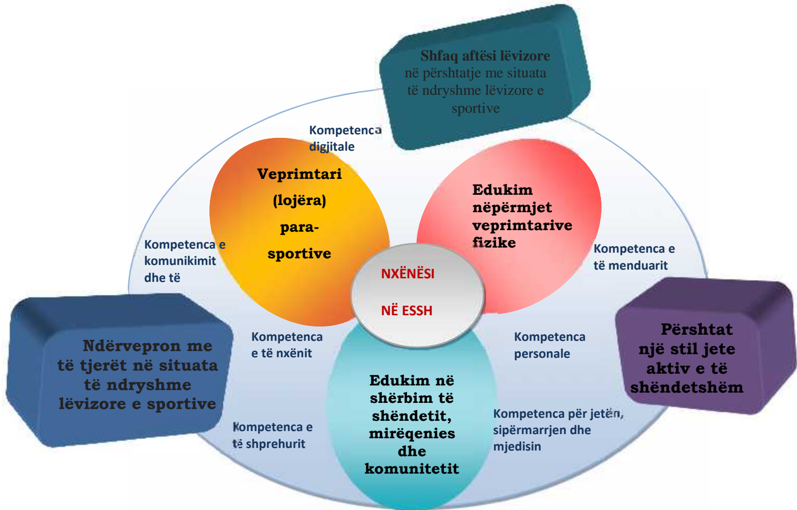
Diagrami 4: Kompetencat e fushës “Edukim fizik, sporte dhe shëndet” dhe tematikat e fushës.

Bazuar në këtë kurrikul, fusha/ lënda “Edukim fizik, sporte dhe shëndet” synon të përbushë 3 kompetencat e fushës/lëndës, të cilat lidhen me kompetencat kyçe që një nxënës duhet të zotërojë gjatë jetës së tij dhe që arrihen nëpërmjet 3 tematikave kryesore.