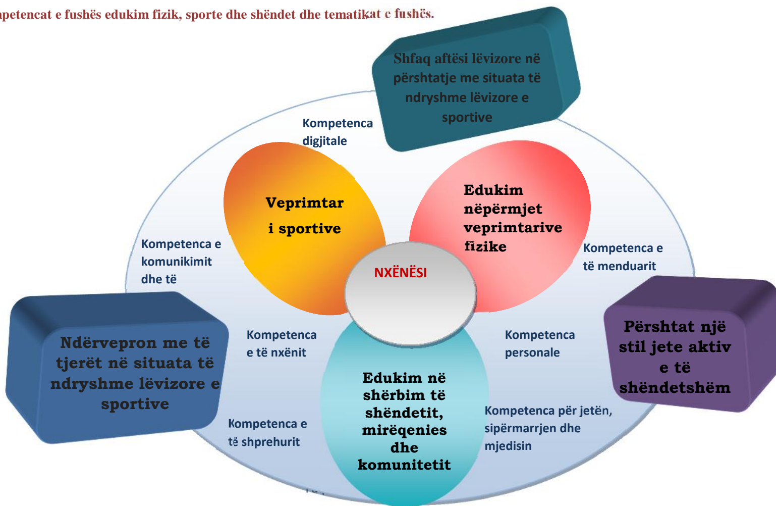
Diagrami 4: Kompetencat e fushës edukim fizik, sporte dhe shëndet dhe tematikat e fushës.

Bazuar në këtë kurrikul, fusha/ lënda “Edukim fizik, sporte dhe shëndet” synon të përmbushë 3 kompetencat e fushës/lëndës, të cilat lidhen me kompetencat kyçe që një nxënës duhet të zotërojë gjatë jetës së tij dhe që arrihen nëpërmjet 3 tematikave kryesore.