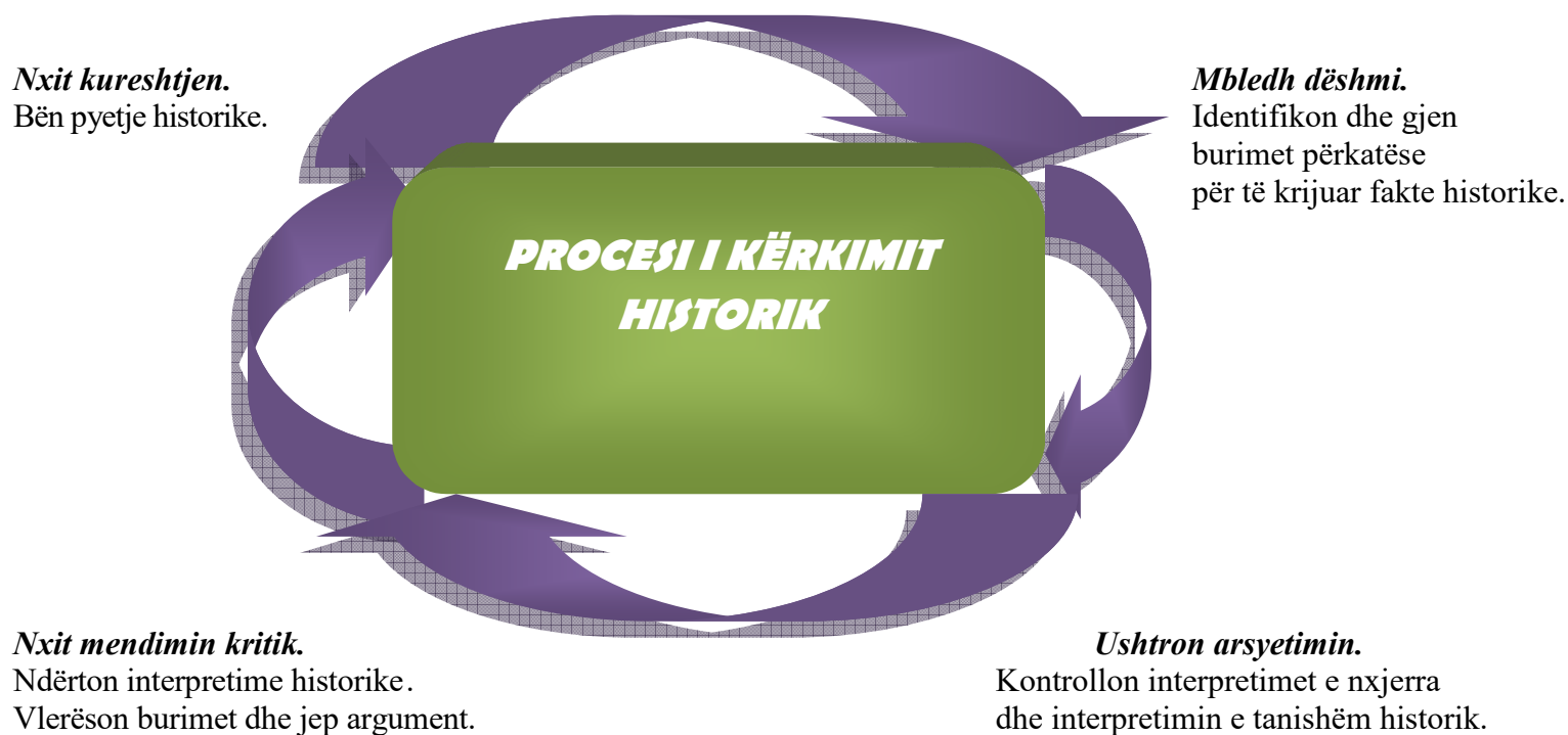
Figura 1. Procesi i kërkimit historik

Përdorimi i kërkimit historik duhet të jetë në qendër të mësimin të historisë dhe mësuesit duhet t'i krijojë mundësinë nxënësit për të mësuar aftësitë e nevojshme përmes praktikës dhe angazhimit në kërkimin historik. Përdorimi i pyetjeve në çdo njësi mësimore siguron një pikë kontakti për nxënësit për të kërkuar, sistemuar dhe analizuar informacion në përgjigje të çështjeve që hulumtohen në