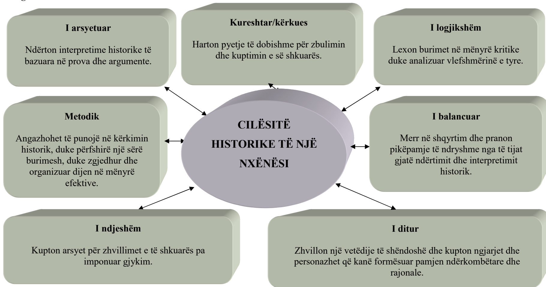
Diagrami 5. Cilësitë historike të nxënësit

Lënda e historisë i ndihmon nxënësit që të bëhen të ditur, të logjikshëm, kureshtarë, të balancuar, të ndjeshëm dhe individë të aftë për të dhënë argumente dhe për të marrë vendime të arsyetuara mirë.