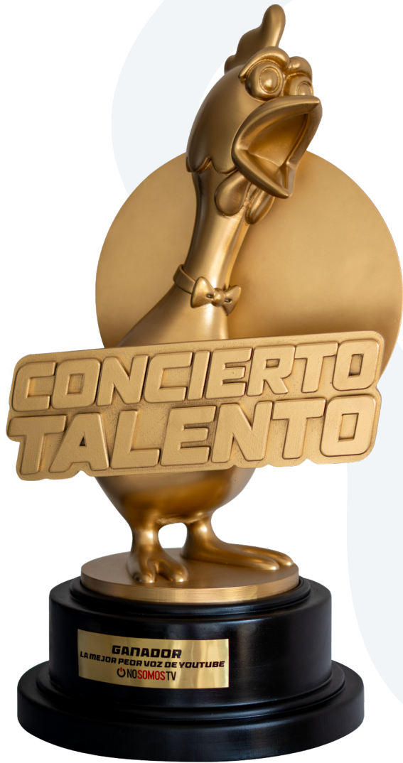
Trofeo PREMIUM para Concierto Talento + placa de bronce Material: Filamento PLA con postprocesado y acabado pintado