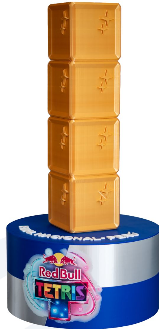
Trofeo ESTÁNDAR para Red Bull Material: Filamento PLA con color