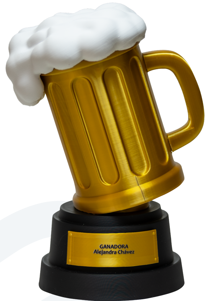
Trofeo ESTÁNDAR para Backus Material: filamento PLA con color