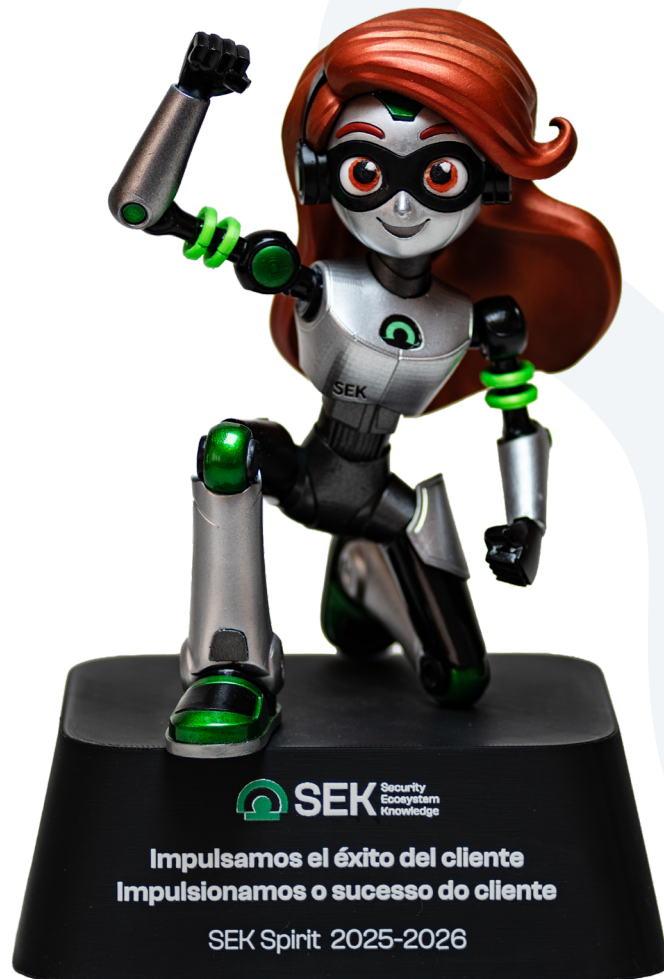
Trofeo PREMIUM para Sek Material: resina acabado metálico