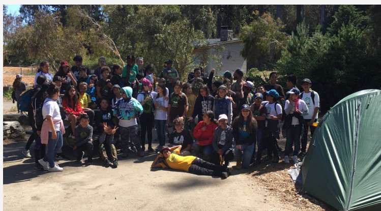
Estudiantes de séptimo grado y líderes de crew de séptimo grado acampando en el Presidio.