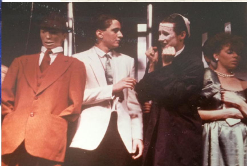
Représentation de pièces de Jean Tardieu par l'option théâtre du Mont, mises en scène par Hubert St-Germain. 1984.

Archives - Frères des Écoles chrétiennes du Canada francophone, Fonds Mont-de-La-Salle, N50021, 511080.