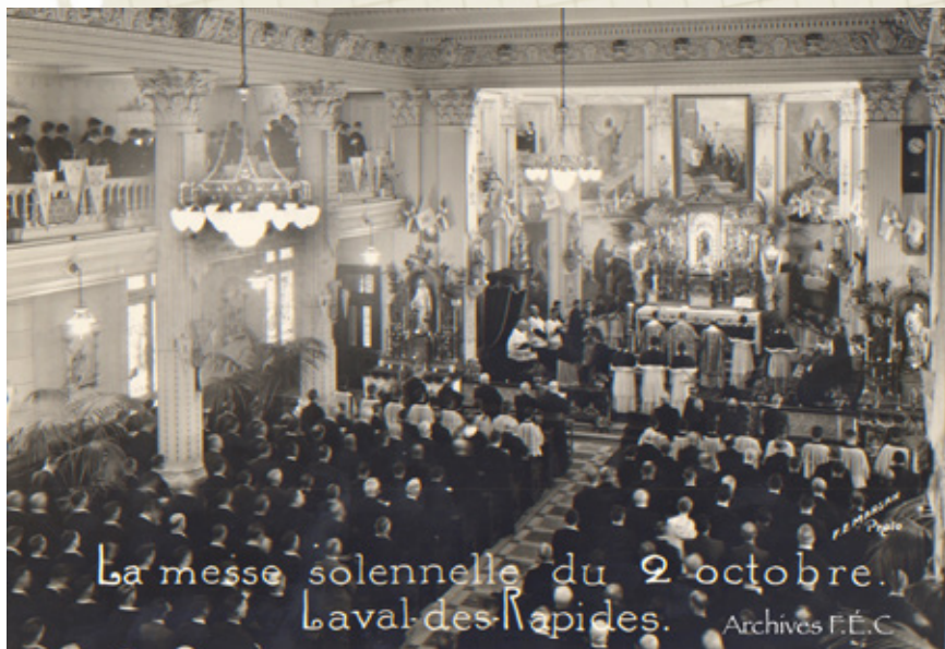
Messe solennelle du 2 octobre 1937 à l'occasion du centenaire de l'arrivée des Frères des Écoles chrétiennes au Canada.

Archives - Frères des Écoles chrétiennes du Canada francophone, Fonds Mont-de-La-Salle, N50021, 511080.