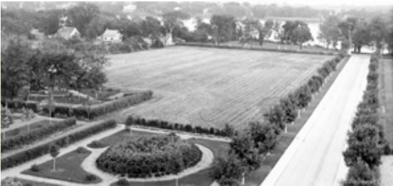
L'allée centrale menant au Mont-de-La Salle de Laval-des-Rapides. Le terrain de gauche en culture [entre 1920 et 1940].

Le nouveau Mont-de-La Salle ouvre ses portes le 11 avril 1917. Il est un des premiers bâtiments de béton armé construits au Canada. Il faudra douze ans de plus pour ériger la chapelle (1929). Dix-huit ans plus tard, en 1947, elle sera dotée de l'orgue Casavant actuel : le plus imposant encore à ce jour sur l'île de Laval.