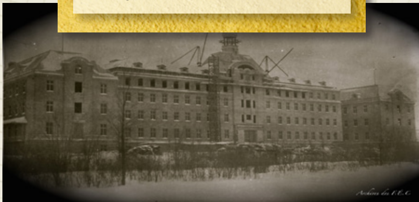
Construction du Mont-de La-Salle, 4 janvier 1916.

Archives - Frères des Écoles chrétiennes du Canada francophone, Fonds Mont-de-La-Salle, N50021, 511078.