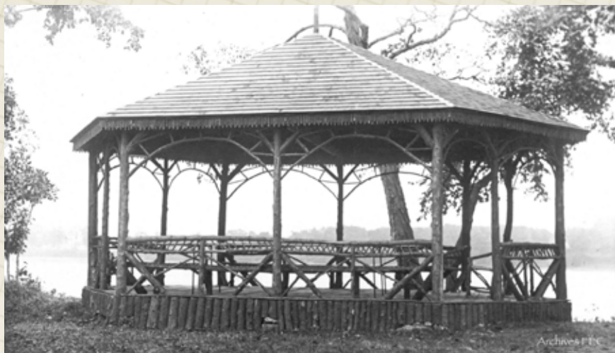
Kiosque du Mont-de-La Salle sur le bord de la rivière des Prairies avant le barrage de 1929 [avant 1929].

Archives - Frères des Écoles chrétiennes du Canada francophone, Fonds Mont-de-La-Salle, N50021, 511079