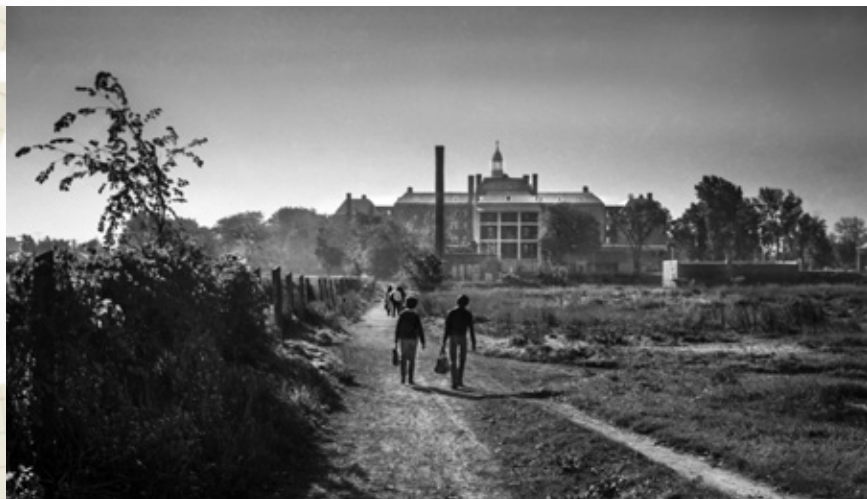
Chemin du Mont.