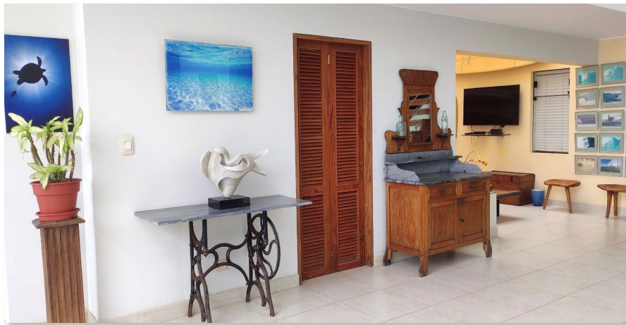
Hall y Entrada