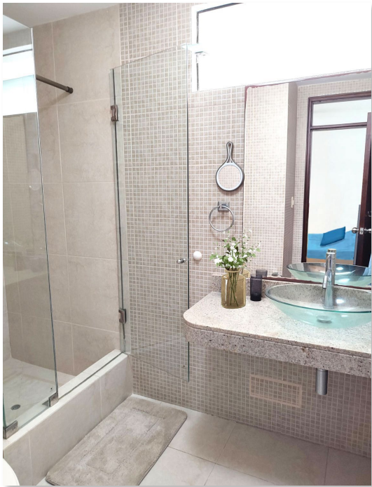
Dorm. 4 2do Piso Baño incluido