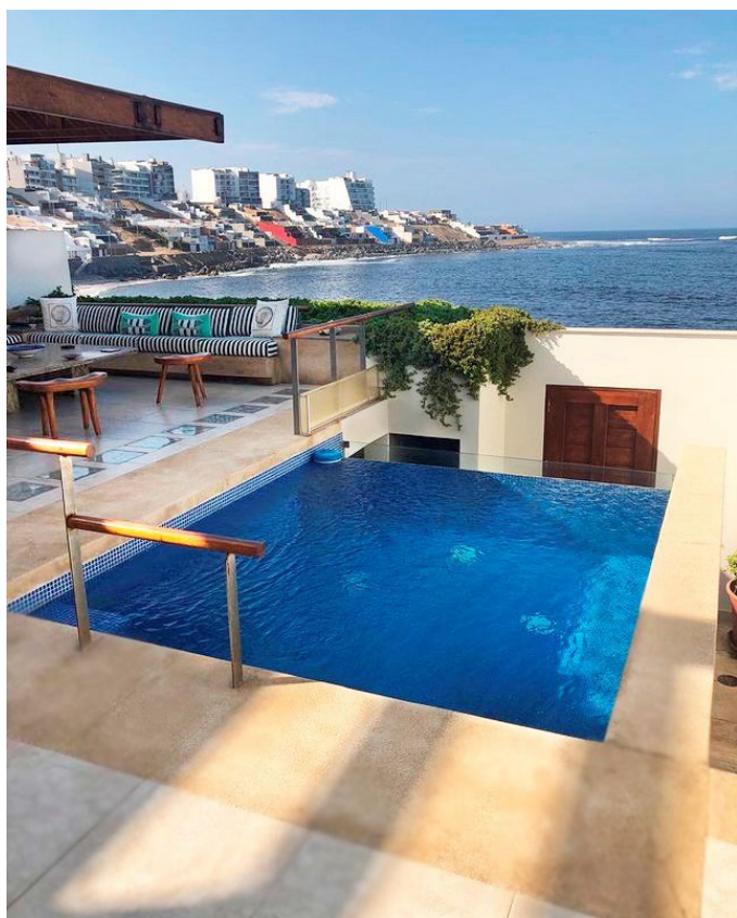
Piscina y área de BBQ