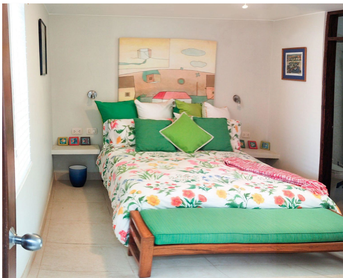
Dorm. 1 1er Piso Baño incluido