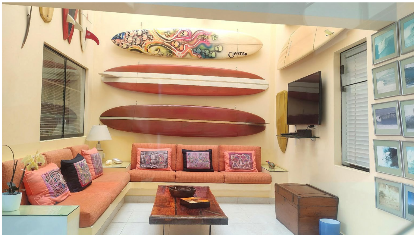
Sala de estar y TV