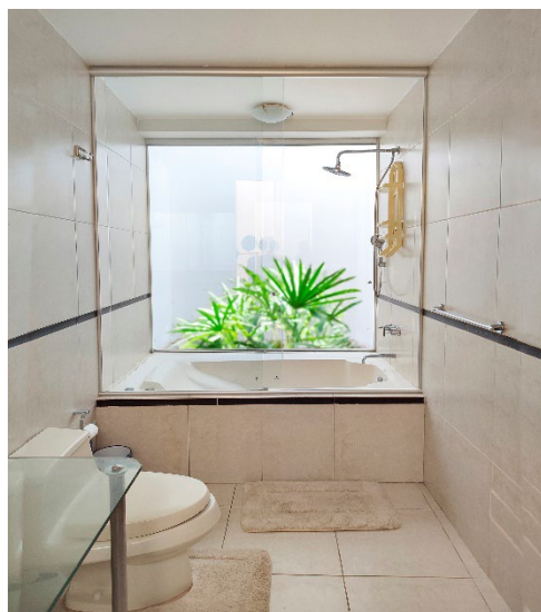
Dorm. Principal 2do Piso - cama King Balcón y baño incluido