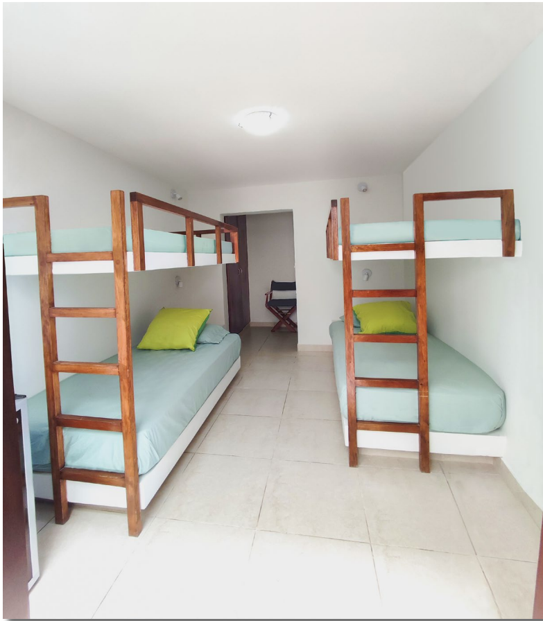
Dorm 2 1er Piso - 4 Camas, Baño incluido