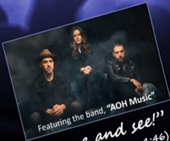
Featuring the band, "AOH Music"