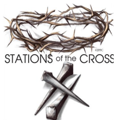
STATIONS of the CROSS

O God, you are my God- for you I long! For you my body yearns; for you my soul thirsts, Like a land parched, lifeless, and without water. So I look to you in the sanctuary to see your power and glory. Psalm 63: 1-3