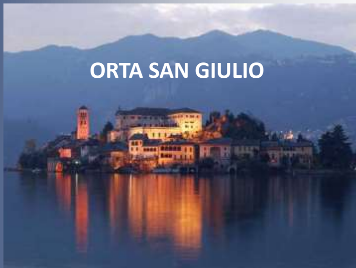
ORTA SAN GIULIO