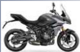
CATEGORIE D Suzuki 650 Vstrom Triumph 660 Tiger Sport