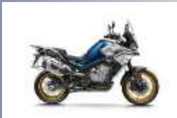
CATEGORIE C CF Moto 800 MT BMW F750 GS* Moto Guzzi V85TT