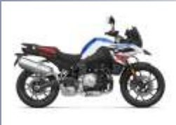
CATEGORIE B Suzuki GSX S 1000 GX Guzzi Stelvio 1000