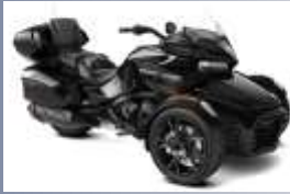
CATEGORIE SPYDER ** Can-Am SPYDER F3 T Limited Can-Am SPYDER RT Limited