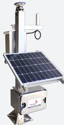
RTK Flex AVANZADO