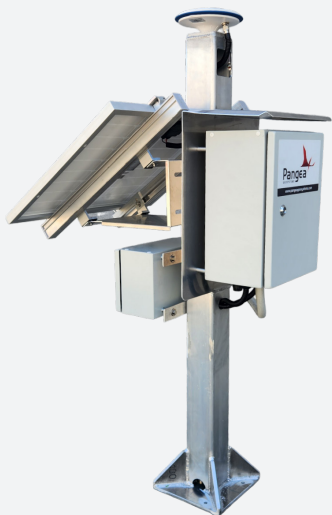
RTK Flex BÁSICO