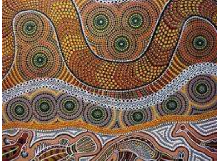
Şekil 3. Aborjin Sanatı

Permakültür bizlere doğanın harikalarına ve karmaşıklığına bakarak sorunları fırsatlar olarak görmemizi sağlayan farklı bir pencere sunar. Olguları bu olumlu yaklaşımla değerlendirdiğimizde sorunların üstesinden gelmek kolaylaşır. Permakültür büyük bir çözümler matrisidir. Her sorun için olası pek çok çözüm vardır. Permakültür bize şartlarımıza ve bölgemize uygun çözümleri seçmemiz için gereken ilkeleri sunar. Bu ilkeleri uygulayarak ulaşılacak semereyi sınırlayacak olan sadece tasarımcının bilgi birikimi ve hayal gücüdür. Sürekli bir öğrenme ve hayal etme imkânı da bulaşıcı olabilecek bir güzellik değil midir?