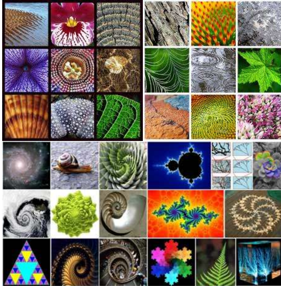
Şekil 1. Örüntü Örnekleri

İngilizce "pattern" kelimesinin karşılığı olarak kullandığımız örüntü kavramı doğada var olan temel formları ifade ediyor. Ne kadar karmaşık ve kaotik görünse de doğada gördüğümüz her şey temel bazı formların farklı boyutlarda tekrarlanmasından oluşuyor. Doğanın geometrisinde boyutların da sınırlı sayıda olduğunu Permakültür sayesinde öğrendim. Örneğin çöllerde rüzgârla titreyen kum tanelerinden hiç yer değiştirmeden kalan 'Zorg'lara sadece 5 farklı büyüklük boyutu var. Ağaçların 7 ila 9, insan ise 7 boyutlu bir form. Matematikğin doğanın geometrisiyle uğraşan dalına fraktal geometri deniyor.