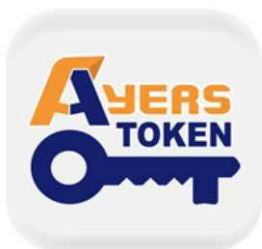
Ayers 保安編碼 艾雅斯資訊科技有限公司

https://cis-cdn.azureedge.net/software/StockTrade2FA.apk