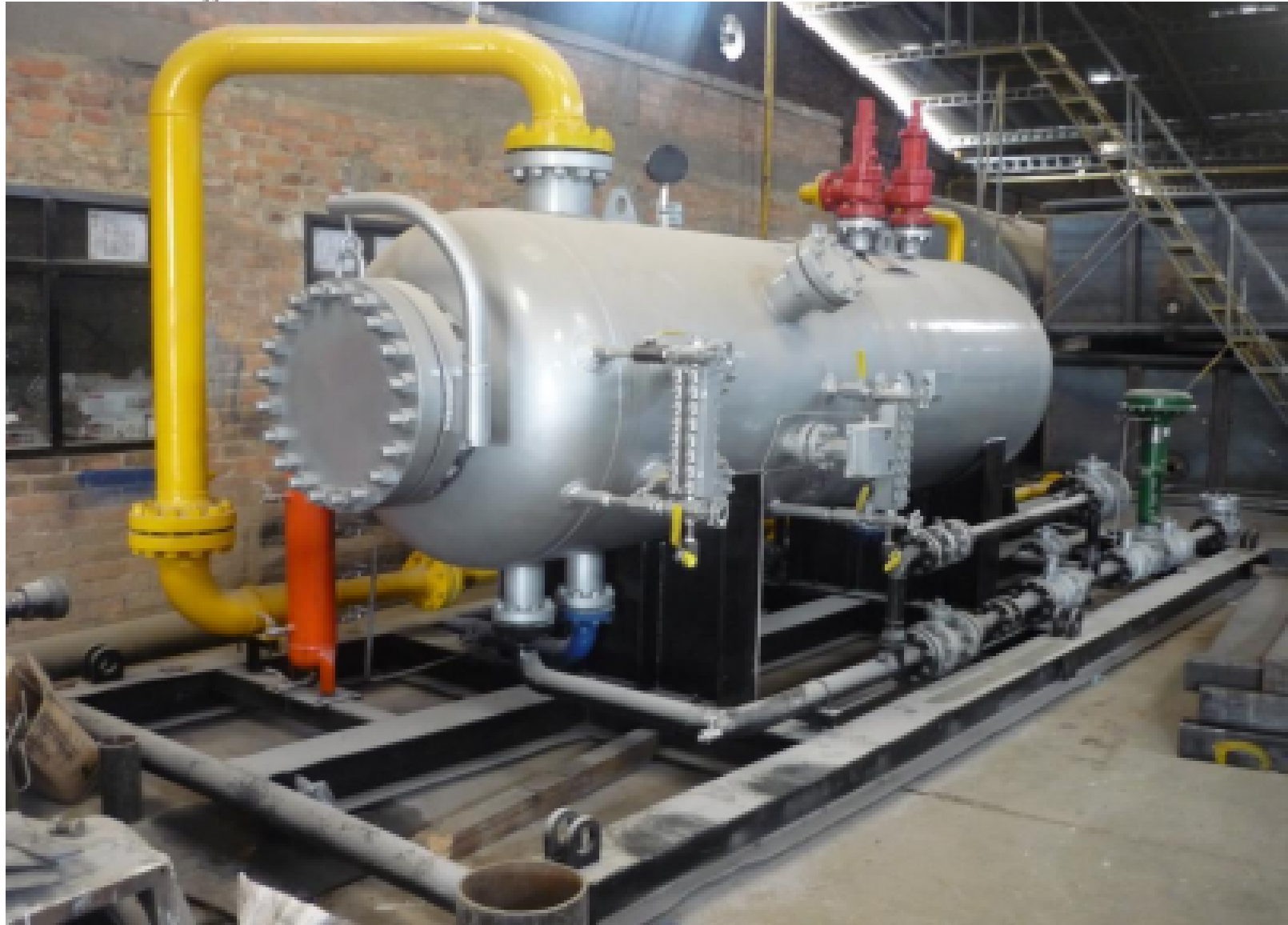
SEPARADOR TRIFASICO ANSI 300