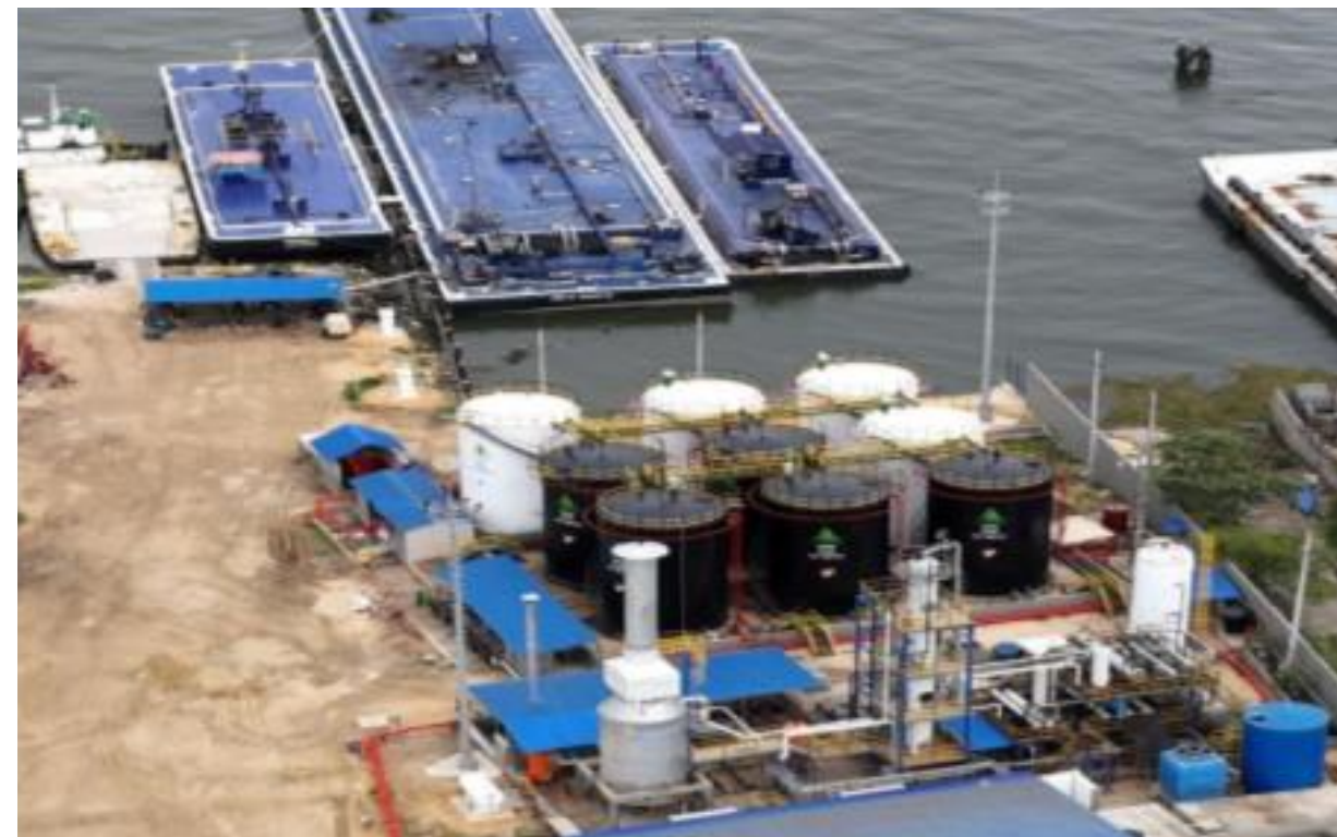
PLANTA CARTAGENA - COLOMBIA