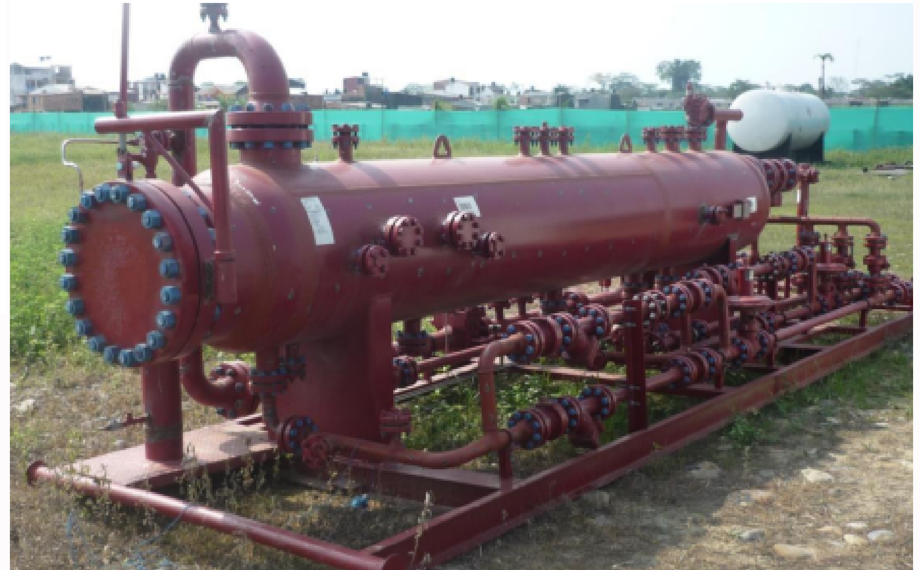
SEPARADOR TRIFASICO ANSI 150 CAP. 5000 BBLs