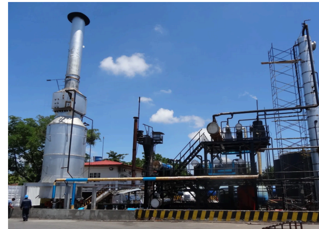
PLANTA FLANDES- COLOMBIA