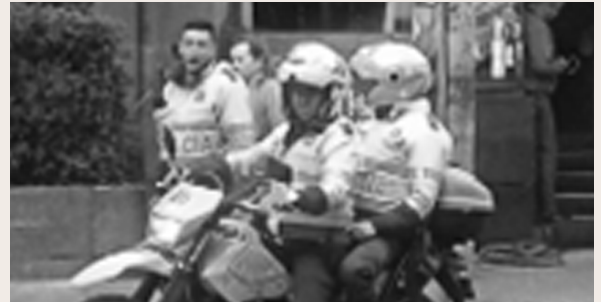
Señora retenida saliendo de un establecimiento luego de hurtar.

En junio de 2018 se instalaron 10 aplicaciones de prueba a algunos Asociados, para reportar las novedades más importantes que se presentan en el sector. Por medio de la herramienta se han logrado capturas y asistencias del cuadrante de la policía, entre otras.