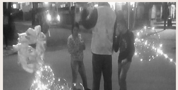
Apoyo del cuadrante para retirar vendedores ambulantes.