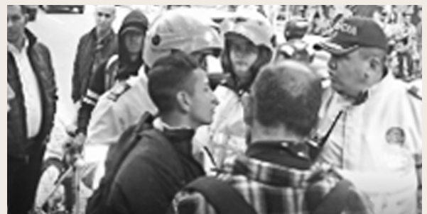
Se retiene joven el cual pretendía hurtar una bicicleta.