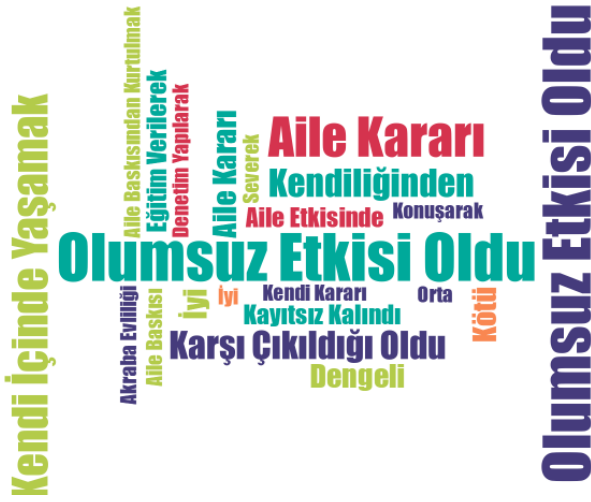
Şekil 2. Evlilik Deneyimleri ve Erken Evliliklerin Önlenmesine İlişkin Kod Bulutu

Çalışmada kullanılan veri kodlarına ilişkin yoğunluk tablosu Şekil 1’de gösterildiği gibidir. Kod bulutuna göre “Aile Kararı”, “Erken Evliliğe İlişkin Olumsuz Tutum” ve “Kendi İçinde Yaşamak” veri kodlarının yoğunluk bakımından öne çıktığı görülmektedir