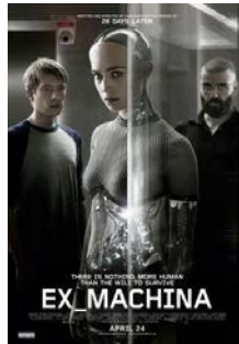
Görsel 5. Ex machina filmi