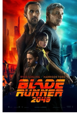
Görsel 3. Ölüm Takibi 2049 filmi afişi.

Gelecekte, insandan ayırt edilemez yapay insanlar (replikantlar) üretilmektedir. Rick Deckard, kaçak replikantları "emekli eden" (onları sonlandıran veya öldüren) bir avcıdır. Filmler, replikantların bilinç, bellek ve kimlik sorunlarını merkeze almaktadır.