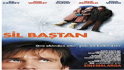
Görsel 4. Sil Baştan filminin filmi afişi.

Joel ve Clementine, acı veren ilişkilerini unutmak için birbirlerine dair anılarını sildirirler. Film, bellek silme prosedürü sırasında Joel'in zihninde geçer ve anıların silinmesine direnişini anlatır.