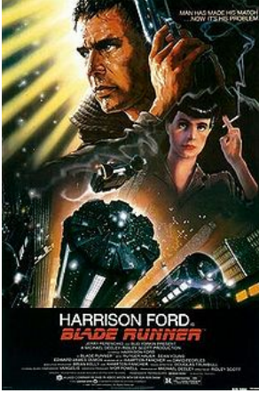
Görsel 2. Ölüm Takibi filmi afişi.