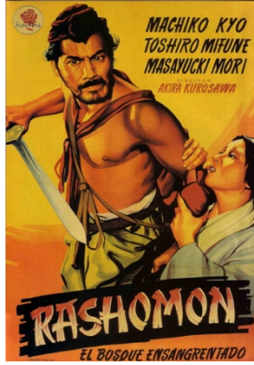
Görsel 7. Rashomon filmi afişi

Film, bilginin sınırları sorusunu kozmik bir ölçekte ele almaktadır. Bilgi, "özne ile nesne arasındaki ilişkiden" doğar. Ancak bu ilişkiyi kurmak imkânsız olduğunda ne olur? Solaris, epistemolojinin en derin sorunlarından biriyle hem ana karakteri hem de seyirciyi yüzleştirir: Tamamen yabancı bir gerçekliği bilmek mümkün müdür? Sorusu filmin çekirdeğini oluşturur.