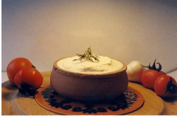
Şekil 5: Antakya Tuzlu Yoğurdu (TÜRKPATENT, 2025).

10.09.2020’de mahreç iřaretiyle tescillenen Antakya Tuzlu Yoğurdu, Hatay yöresinde oldukça ünlü bir yoğurt çeşididir. Geçmiři yaklaşık 100 yıla dayanan bu yoğurdu ister keçi sütüyle ister inek sütüyle üretebilirsiniz. Genel olarak keçi sütüyle üretilen bu yoğurt beyaz ve parlak bir yapıya sahiptir. Mayalamak içinse kaya tuzu ve yoğurt kullanılır. Üzerini kapatmak içinse zeytinyağı tercih edilir. Duyusal analizinde ise dilde ekşimsi ve tuzlu bir tat bırakırken genizde hafif tütsü tadı da bırakabilmektedir. Geleneksel üretimde süt ilk olarak yoğurda çevrildikten sonra yoğurt süzülür ve kazanlarda pişirilir.