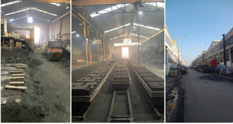
Şekil 1. Konya Büsan OSB Sanayi Tesisleri

2025 yılı itibari ile 12 organize bölgesine, 80 sanayi tesisine ve 2 endüstri bölgesine sahip olan Konya, sanayi açısından gelişmiş bir kenttir. Ayrıca küçük ölçekli 123 sanayi sitesinde 19.000'in üzerinde işyeri bulunmaktadır ve yaklaşık 124.000 kişi istihdam edilmektedir.