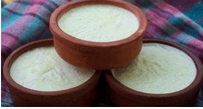
Şekil 9: Kandıra Manda Yoğurdu (TÜRKPATENT, 2025).

26.09.2023'te menşee adıyla tescillenen Kandıra Manda Yoğurdu Kocaeli ilinin Kandıra ilçesinde doğan, yörede beslenen mandaların yağı alınmamış sütünden üretilen sert yapıda, kalın bir kaymak tabakasına sahip bir yoğurt çeşididir. Hem geleneksel hem de endüstriyel bazda üretimleri mevcut olup eğer geleneksel yollar mayalanacaksa yörenin “kara maya” olarak adlandırdığı maya ile mayalanmaktadır. Kocaeli ili yağış bakımından zengin