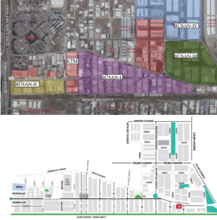
Şekil 2. Konya BÜsan Özel OSB Konumu

Caddesi, Aslım Caddesi, Demir Caddesi ve Özlem Caddesi arasında yer almaktadır (bkz. Şekil 1-2).