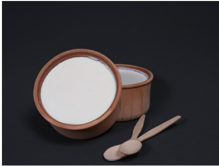
Şekil 12: Silifke Yoğurdu (TÜRKPATENT,

07.02.2022 tarihinde mahreç işaretiyle tescillenen Silifke