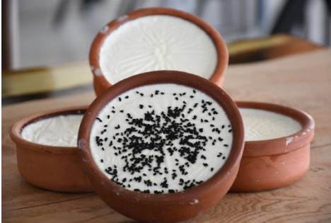
Şekil 8: Eşmekaya Yoğurdu (TÜRKPATENT, 2025).

25.05.2021 tarihinde menşe adıyla tescillenen Eşmekaya Yoğurdu Aksaray iline özgü olup koyun sütünden üretilen koyu kıvamlı bir yoğurttur. Koyunlar Eşmekaya bölgesinde endemik bitkilerle beslenmesinden kaynaklanan bu koyu kıvamlı yoğurdun mayası da kendisinden üretilmektedir. Bu yoğurt artık tüm yıl boyunca yapılabilen bir yoğurt çeşididir fakat eskiden belirli mevsimlerde üretimi gerçekleşmekteydi. Eşmekaya