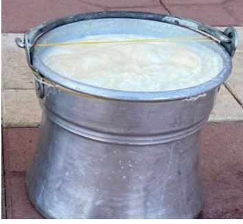
Şekil 7: Ereğli Koyun Yoğurdu (TÜRKPATENT, 2025).

sınırlar içerisinde beslenen koyun sütleri kullanılır. Eğer evde yapılacaksa odun ateşinde sağılan süt iyice kaynatılır ki bu 90 °C'ye ulaştığında yaklaşık 20 dakika boyunca kaynama işlemine devam edilir. Bu yoğun kaynatma işlemi sonrası yoğurdumuzda geleneksel bir yanık tat aroması kazandırılmış olur. Kaynayan süt soğumaya bırakılır ve 40-45°C'ye geldiğinde Ereğli Koyun Yoğurdu'ndan öncesinde süt/maya içeriği %2 olarak hazırlanan mayayla mayalanır. Üzeri bezle örtülen yoğurt oda sıcaklığında yaklaşık olarak 2-3 saat süre bandında bekletilir (TÜRKPATENT, 2021).