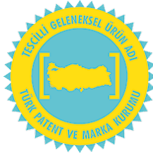
Şekil 3: Geleneksel Ürün Adı Amblemi (TÜRKPATENT, 2025).