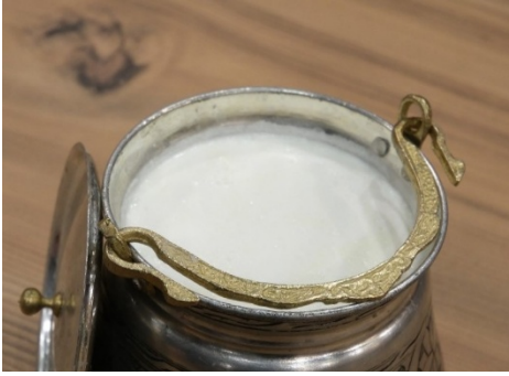
Şekil 10: Karapınar Koyun Yoğurdu (TÜRKPATENT, 2025).

05.09.2025 yılında mahreç işaretiyle tescillenen ve Konya iline özgü olan Karapınar koyun yoğurdu; Merinos, Akkaraman, Akkaraman Melezi ve Anadolu Merinos’u ırklarına ait koyunların sütünden üretilmektedir. Koyunlardan sağılan sütler 40 kg bidonlarda biriktirilir. Biriken sütler tülbent yardımı ile süzülür ve 1 saat dinlendirilir. Uygun kaplara alınan süz 90-95°C’de 15 dakika ısıtmaya bırakılır. Bu sırada kerpiç veya odun ateşi üzerine bir saç yerleştirilerek sacın üzerine de kum veya kül