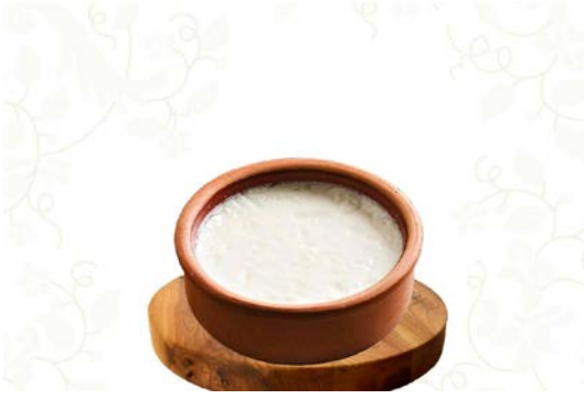
Şekil 11: Mamak Ravak Yoğurdu (TÜRKPATENT, 2025).

sonucu yapılan bir yoğurt çeşididir. Mamak Ravak yoğurdu sert yapıda, porselen beyazı şeklinde tabir edilen bir renge sahiptir. Yoğurdun üretiminde genel olarak coğrafi sınırlar içerisinde yetiştirilen ineklerin çiğ sütü kullanılmaktadır. Yoğurdun yapımında ilk olarak sütün kaymağını ayırmak adına süt işleme makineleri yani seperatörler kullanılır ve kaymakaltı sütü ayrılır. Ardından süt en az pastörizasyon normlarında ısıl işleme tabii tutularak kaynatılır. İnokülasyon işlemi için ortalama kaynatılan süt soğutulur ve ortalama 5 litre süte %2 oranında ravak mayası kullanılmak suretiyle inokülasyon işlemi başlar. Ortalama 45°C’de 4-5 saat aralığında inkübasyon işlemi yapılır. Mayalama işlemi sonunda ön soğutma yapılır ve ardından tüketime hazır hale gelen Mamak Ravak Yoğurdu, 4-6°C’lerde muhafazası sağlanır (TÜRKPATENT, 2021).