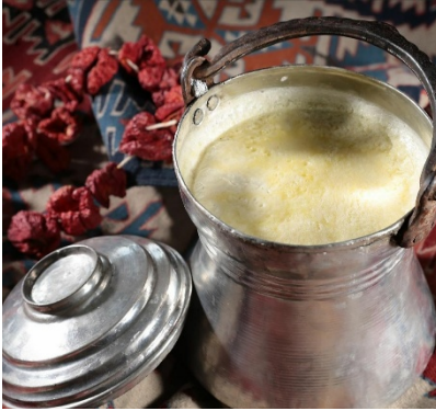
Şekil 6: Emirdağ Koyun Yoğurdu (TÜRKPATENT, 2025).

6.09.2021'de mahreç iřaretiyle tescillenen Emirdağ Koyun Yoğurdu Afyonkarahisar iline özel koyun sütün-den üretilen yoğun kıvamlı bir yoğurt çeşididir. Üzerinde sarı tonlarının hâkim olduđu bir kaymak tabakası bulunurken genel görüntüsü beyazımsı ve kıvamlıdır. Geleneksel olarak yoğurdun yapımında ilk olarak koyun sütü sağıldıktan sonra uygun bir kapta ısı ile kaynatılır. Kaynama iřlemi başladıktan sonra da belli bir süre çerçevesinde süt kaynatılmaya devam edilir ama 10 dakikanın sonunda artık soğumaya bırakılır. Mayalama hazır hale gelen süt uygun bir kaba alınarak 1 litre koyun sütüne karşılık 20 g yine koyun yoğurdu ilk başta bir miktar sütle karıştırılır ve ayranımsı bir hale getirilerek mayalanır. Kışın 50-55°C'de yazın 40-45°C'de mayalanır.