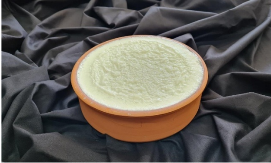
řekil 13: Silivri Yoęurdu (TRKPATENT, 2025).

26.07.2022 tarihinde Mahre iřaretiyle tescillenen ve İstanbul iline zg bir yoęurt eřidi olan Silivri yoęurdu, %50