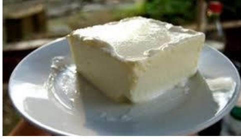
řekil 4: Afyon Manda Yoğurdu (TÜRKPATENT, 2025).

27.07.2021’de menře adıyla tescillenmiř olan Afyon Manda Yoğurdu, Anadolu’da yetiřtirilen mandaların sőtünden veya manda kaymađı üretiminde kaymađı alındıktan sonra geriye kalan sőtle őrütemi yapılan bir yoğurt ęeřididir. Yörede daha ok manda sőtüyle kaymak yapıldıđı bilinmektedir ama bunu zamanla yoğurt da takip etmiřtir.