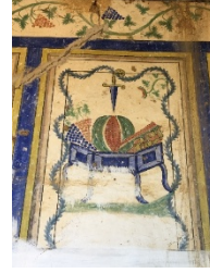
Fotograf 3. Damath Mahallesi Eski Camii (S.E. Koçer, 2018)