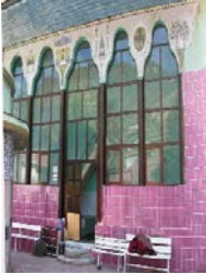
Fotograf 4. Hacıhür Mahallesi Camii (H.Ürer)