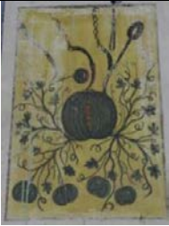
Fotograf 7. Kışlak Eski Camii