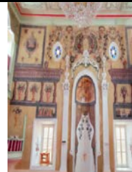
Fotograf 12. Pekmez Pazarı Camii (https://kulturenvanteri.com/yer/)