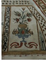
Fotograf 2. Carullah bin Süleyman Camii (S.E. Koçer, 2023)