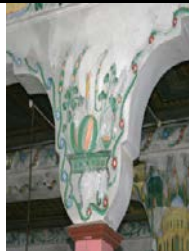
Fotograf 11. Sinirli Mahallesi Camii (B.K.Kasalı)