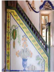
Fotograf 5. Küpeler Mahallesi Camii (C.Gürbıyık)