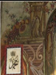
Fotograf 10. Hızır Bey Camii (N.Özkan ve R.Duran)