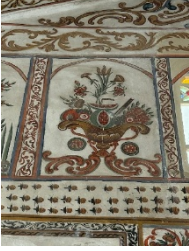
Fotograf 1. Carullah bin Süleyman Camii (S.E. Koçer, 2023)