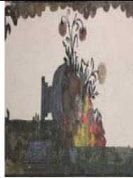
Fotograf 8. Hacı Mehmed Ağa Camii (H.İ.Eryılmaz ve Ş.Ö.Yıldız)