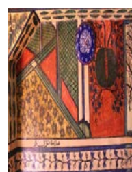
Fotograf 6. Ahatlar Camii